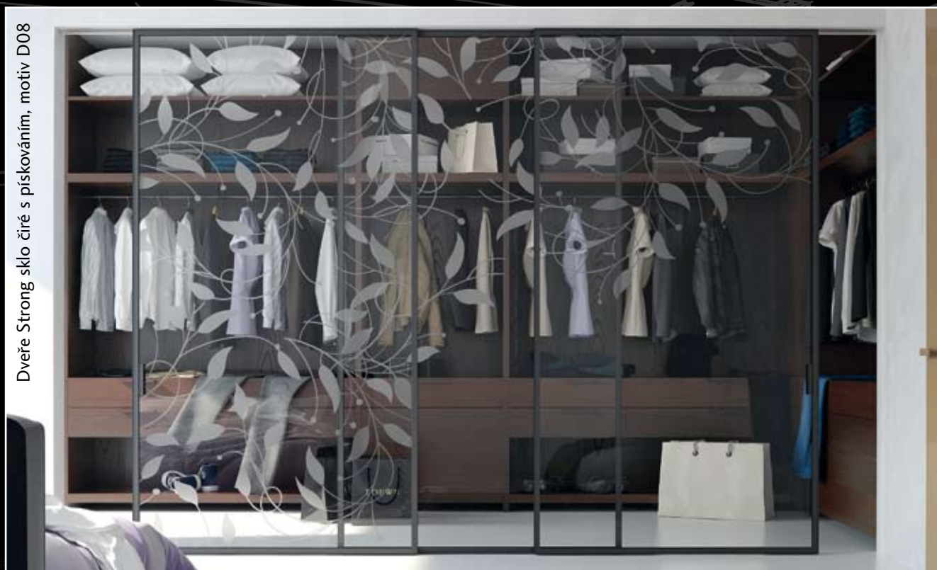
Dveře Strong sklo číré s pískováním, motiv D08