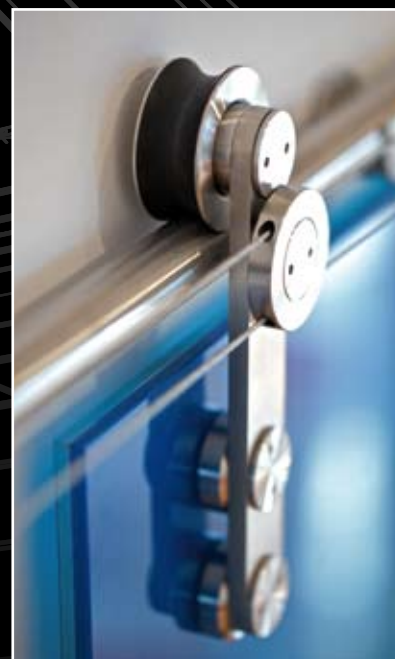
Detail synchronu Rolla.