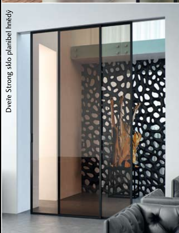
Dveře Strong sklo planibel hnědý