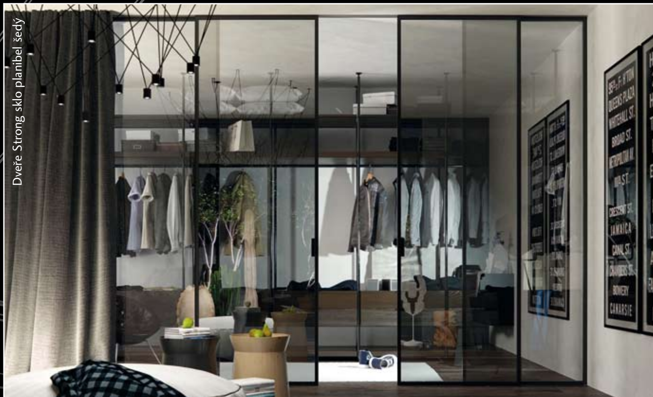
Dveře Strong sklo plamíbel šedý