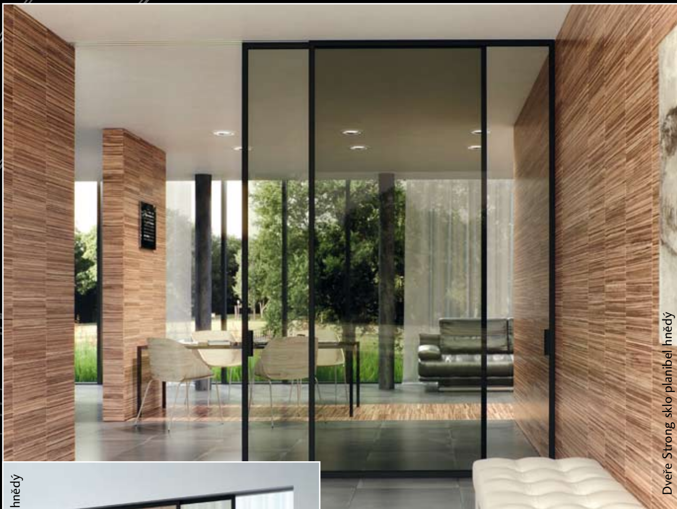
Dveře Strong sklo planibel hnědý